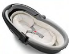
Автокресло «люлька» группы 0 для детей массой менее 10 кг

Детские удерживающие устройства подразделяют на 5 весовых групп: