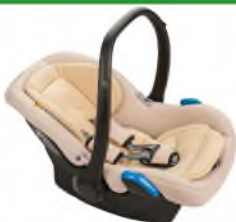
Автокресло группы 0+ для детей массой менее 13 кг