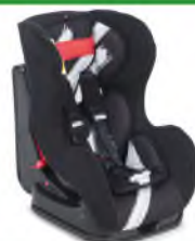
Автокресло группы I для детей массой 9-18 кг