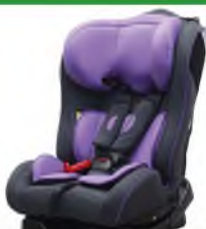
Автокресло группы II для детей массой 15-25 кг